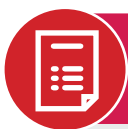
Tabla de especificación