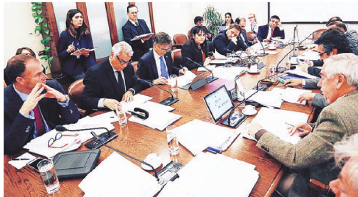
Comisión de Economía de la Cámara de Diputados.

Si bien, hasta el momento, el INE informó que se suspendió de su cargo al jefe del Departamento de Precios de la Subdirección de Operaciones del INE, son tres los imputados, de acuerdo a fuentes de la investigación. ●