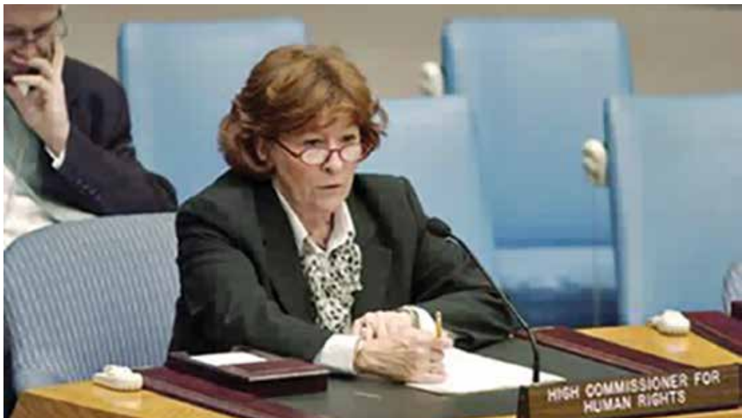
Louise Arbour, Alta Comisionada para los Derechos Humanos (2004-2008), presenta al Consejo de Seguridad las conclusiones de la Comisión Internacional de Investigación sobre Darfur, Sudán (febrero de 2005).

Por su parte, el Consejo de Derechos Humanos respondió, por ejemplo, a las recomendaciones relativas a Côte d'Ivoire (2011) y a la República Árabe Siria (2011) con la designación de expertos independientes, encargados de seguir supervisando la situación de derechos humanos. En otros casos, el Consejo de Derechos Humanos ha creado otros órganos de seguimiento. Por ejemplo, en respuesta al informe sobre Gaza (2009), el Consejo estableció un comité de seguimiento (2010) para "supervisar y evaluar [...] toda actuación interna, legal o de otra índole, que lleven a cabo el Gobierno de Israel y la parte palestina" 97 y en sus sesiones posteriores ha mantenido la situación bajo observación, mediante los informes sobre los progresos realizados. Para dar seguimiento al informe sobre la República Popular Democrática de Corea (2013), el Consejo de Seguridad incorporó la situación de este país a su orden del día, en diciembre de 2014.