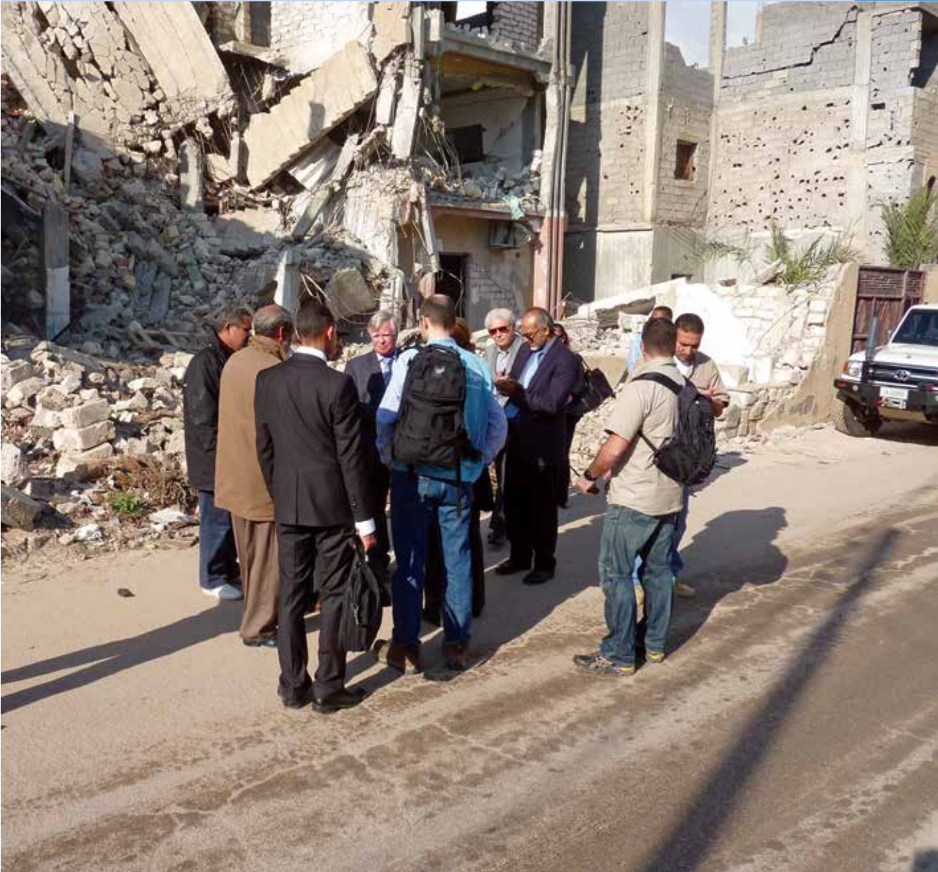
La Comisión de Investigación sobre Libia inspecciona una casa bombardeada en Trípoli.