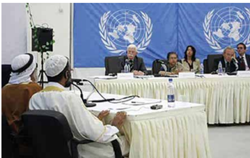
La Misión de Investigación de las Naciones Unidas sobre el conflicto de Gaza celebra una audiencia pública en Gaza para dar a las víctimas, los testigos y los expertos de todas las partes en conflicto la oportunidad de hablar directamente a la comunidad internacional.

En determinados casos, las comisiones/misiones han convocado audiencias públicas para recabar información sobre incidentes o temas que figuraban en su mandato (Gaza (2009) y República Popular Democrática de Corea (2013)). Las audiencias públicas han incrementado significativamente la notoriedad de las investigaciones que las comisiones/misiones llevaron a cabo. Entre otros participantes, a estas audiencias se han presentado: a) víctimas y testigos de presuntas violaciones de derechos humanos y de derecho internacional humanitario; y b) personas expertas en temas que conciernen a los sucesos investigados (por ejemplo, el uso de determinado armamento o la situación de las mujeres). En el contexto de