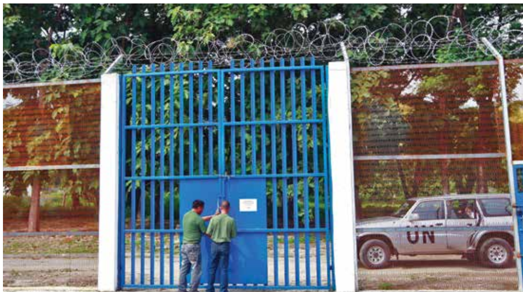
Los miembros de las comisiones de investigación y las misiones de determinación de los hechos necesitan acceso a las víctimas, testigos y fuentes, algunas de las cuales pueden encontrarse en centros de detención.

Desde el principio, los planes de investigación deben integrar los aspectos de género, desde el análisis de las violaciones a investigar y la identificación de las fuentes de información pertinentes, hasta la definición de la metodología, comprendida la previsión de los problemas de género específicos en materia de protección y las medidas para abordarlos.