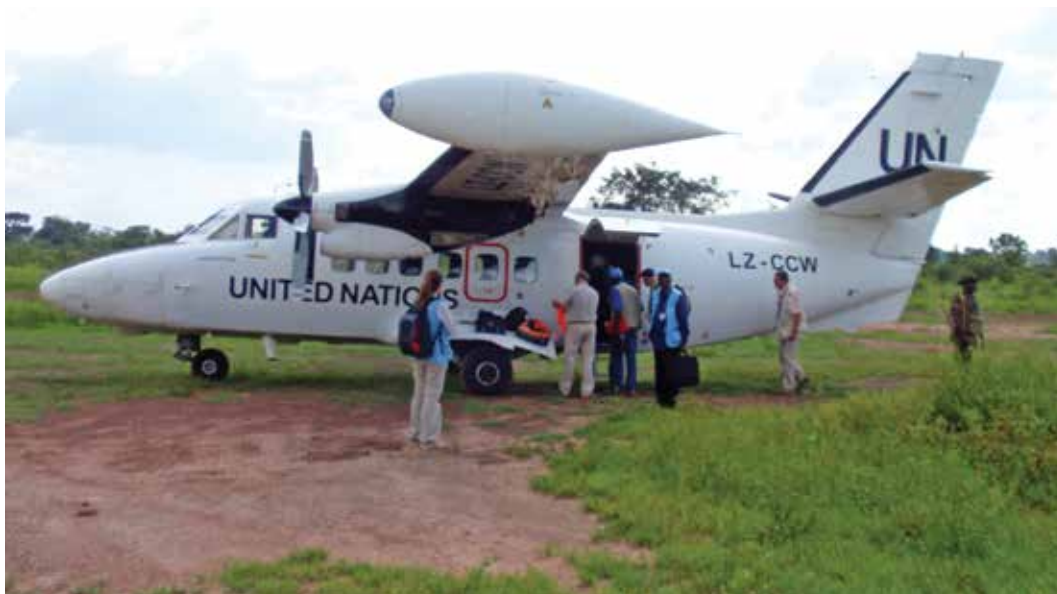
La Misión de Determinación de los Hechos del ACNUDH utiliza los recursos de la Misión de las Naciones Unidas en la República Centroafricana para visitar una zona remota.