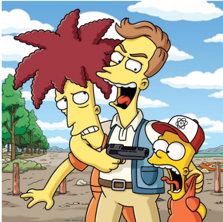
Cometido o intentado cometer