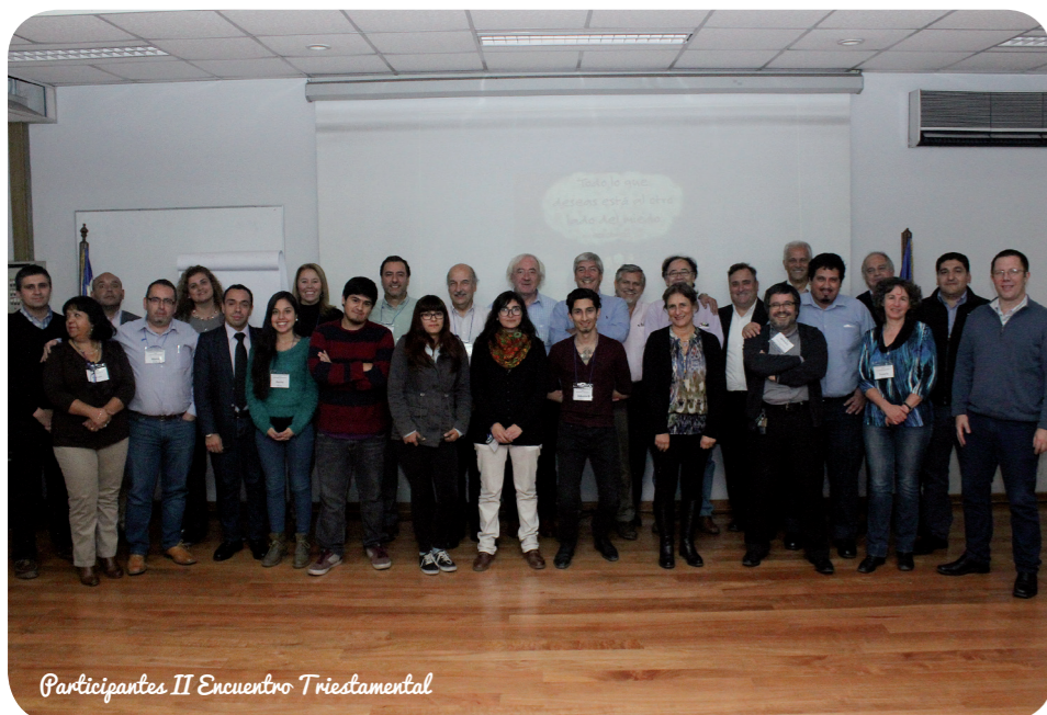
Participantes II Encuentro Triestamental