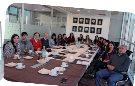
Alumnos de Ingeniería en Alimentos