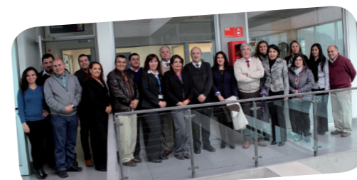
Uno de los tantos desayunos junto a los Funcionarios