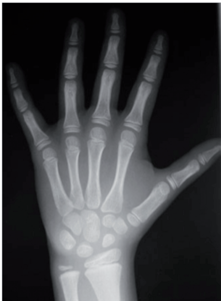
Figura 1. Radiografía posteroanterior de mano y muñeca izquierdas.

La predicción de la talla adulta basándose en la maduración esquelética (EO) es un procedimiento común en endocrinología pediátrica. Esta estimación tiene en cuenta la EC, la EO y la talla actual, considerándose que es concordante con la talla familiar si el resultado se encuentra entre \pm 5 cm de la talla diana, si bien es poco fiable en niños con PP o nacidos pequeños para la edad gestacional.