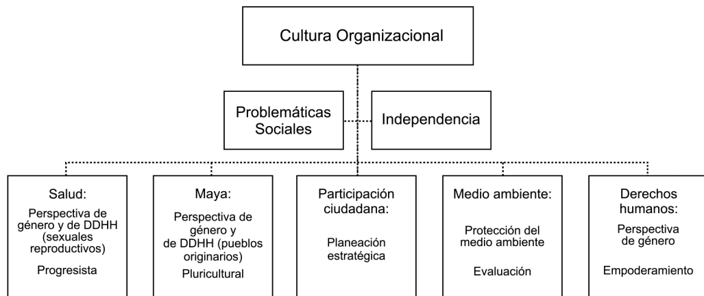
Figura 3. Elementos generales y particulares de la cultura organizacional de las asociaciones civiles

traduce en trabajo prioritario con grupos de mujeres. La otra característica compartida es la independencia; la propia conformación como OSC es un indicativo acerca de esta independencia; sin embargo, existe en todas las organizaciones una marcada tendencia a desligarse de la labor gubernamental que instancias o funcionarios realizan, aun si ésta tiene lugar para la atención de los mismos temas y problemáticas que como asociación atienden: