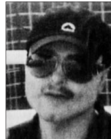
En el 2006, intentó engrosar su rostro nuevamente.