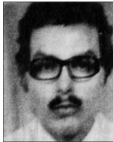
En el 2005, se adelgazó el mentón y su nariz se angostó.