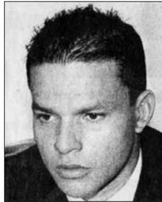
En 1996, cuando se sometió a la justicia y evadió su extradición.

EL tiempo 8 agosto 2007 p.3 "CHUPETA" pasaba por "La Televisión!" The police could only identify him "as the spatzler." Robinson's K. M.