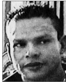
En el 2005. Se alteró las orejas, los párpados y las mejillas.