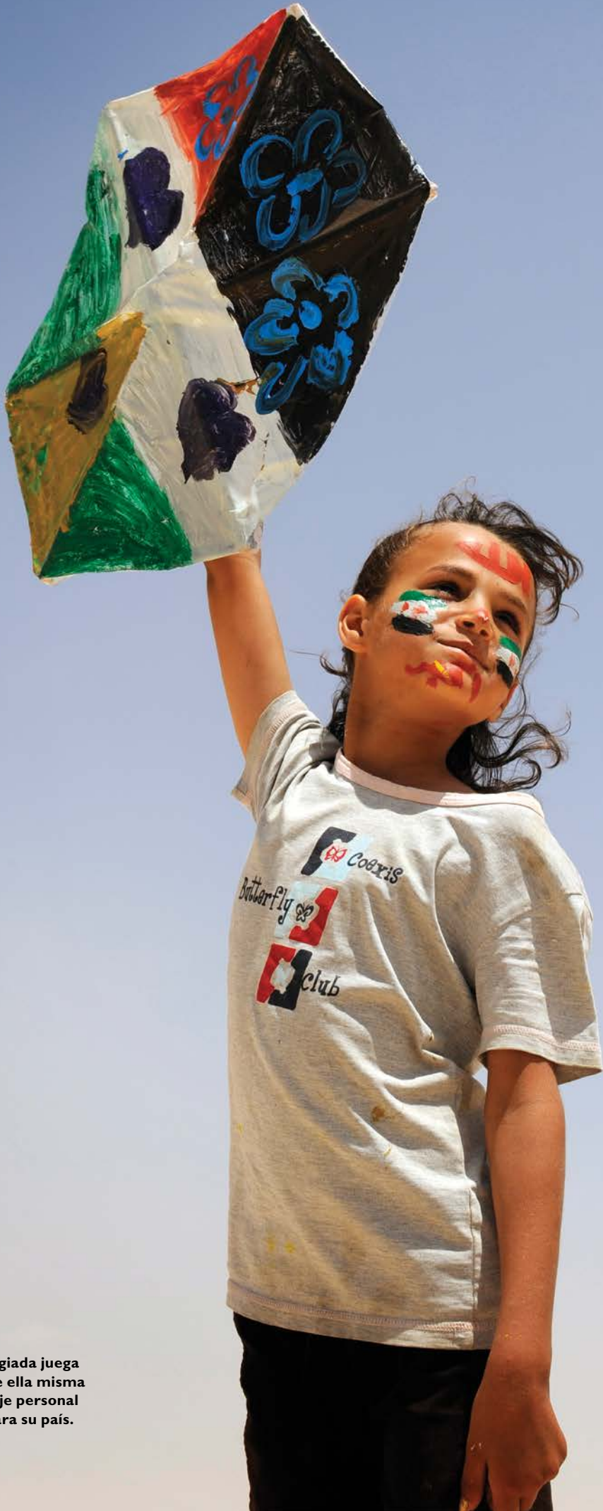
Una niña siria refugiada juega con un cometa que ella misma hizo con un mensaje personal deseando la paz para su país.