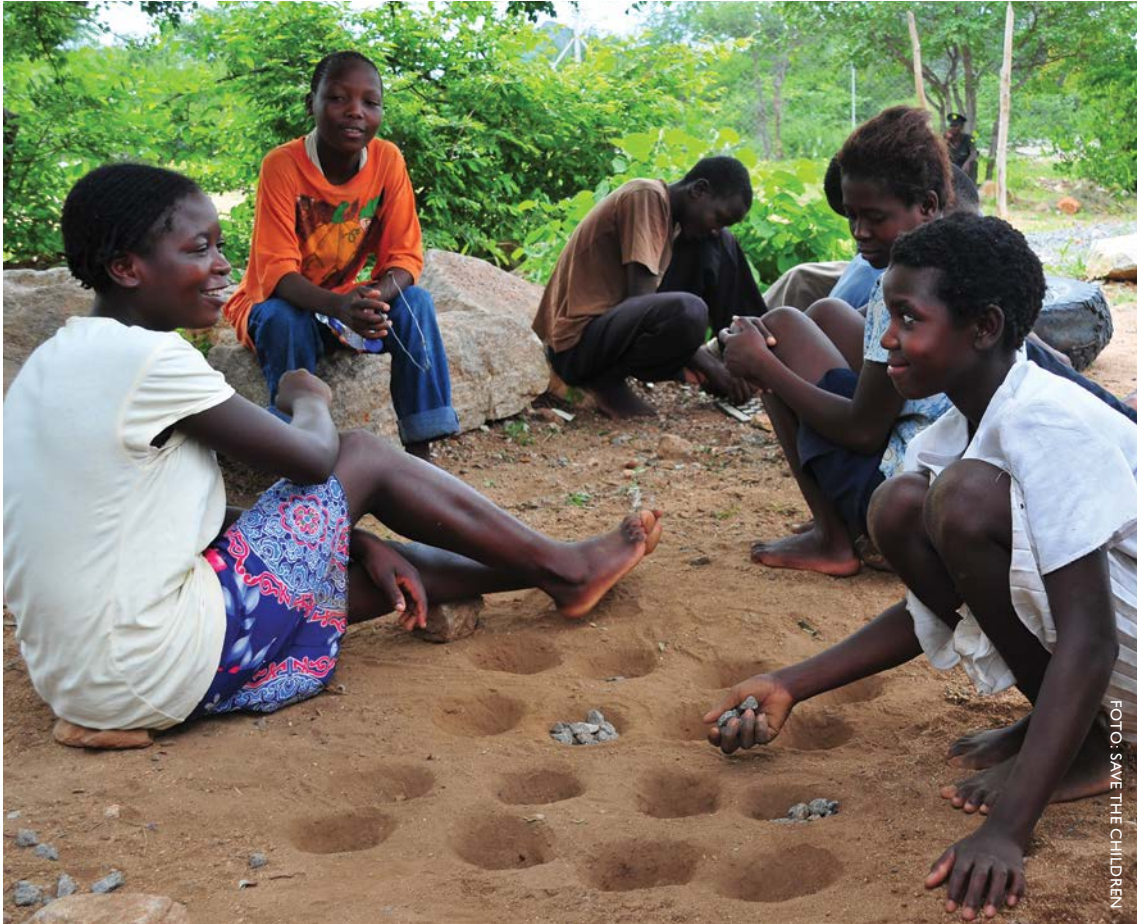
Un grupo infantil en un centro de acogida en Zimbabue para niñas y niños no acompañados que han sido deportados de Sudáfrica.