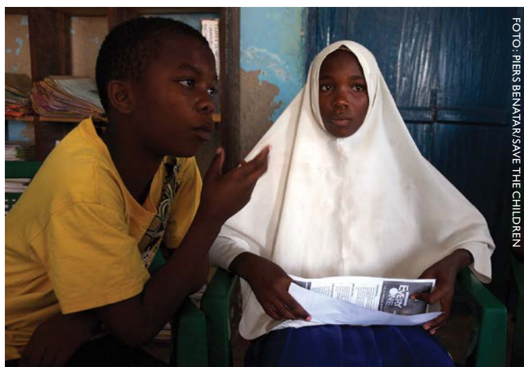
Reunión de un consejo infantil en un pueblo de Tanzania.