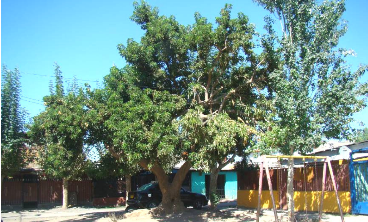
Imagen Ombú existente

2.- Ante esta amenaza contra el patrimonio natural escaso en el barrio, el equipo de la Consultora se propone resignificarlo en el lugar, recuperando el área para uso de juegos infantiles, dado el carácter lúdico que poseen sus raíces.