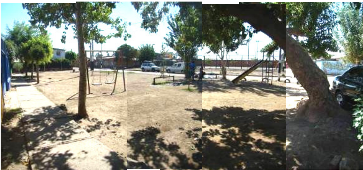
Imágenes situación actual de la Plaza Puerto Montt

En este contexto se propone el diseño del espacio público compuesto por la actual Plaza Puerto Montt y la zona adyacente a la Multicancha, con el fin de consolidar toda una zona que se proyecta con carácter deportivo y recreativo. La Plaza Puerto Montt, es una zona destinada a área verde y está ubicada entre el Pasaje Santa Rosa de Lima y el Pasaje Cañete, limitando en su borde poniente con frentes de vivienda. En su borde oriente cruza la calle Puerto Montt, y enfrenta a la segunda zona de intervención que colinda con la Multicancha existente, la que a su vez será contigua al futuro Edificio Comunitario Deportivo.