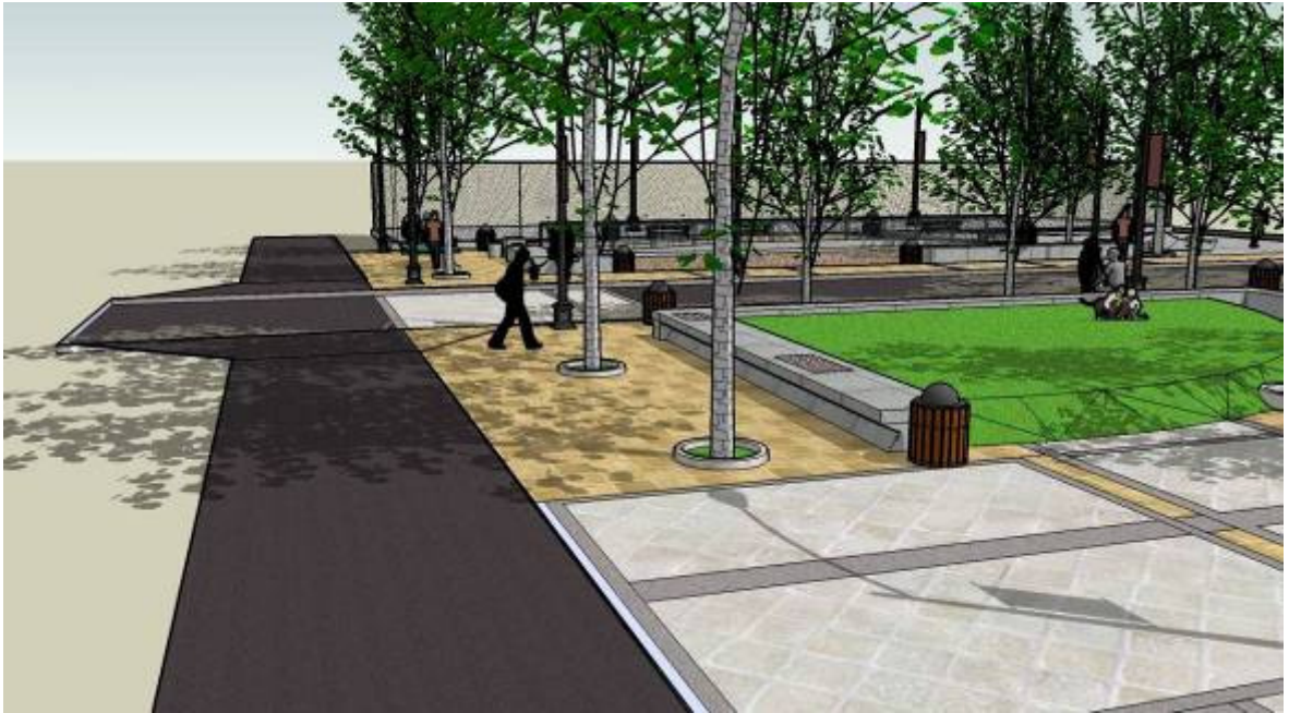
Vista desde Pje. Santa Rosa de Lima.