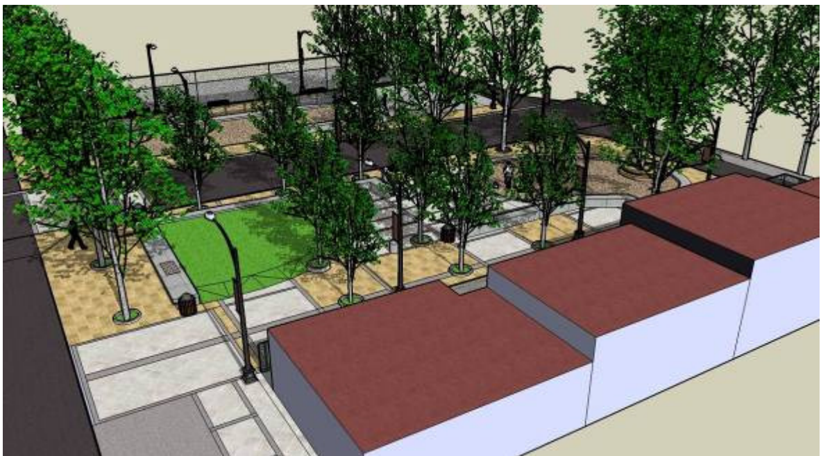
Vista aérea hacia Sur Oriente