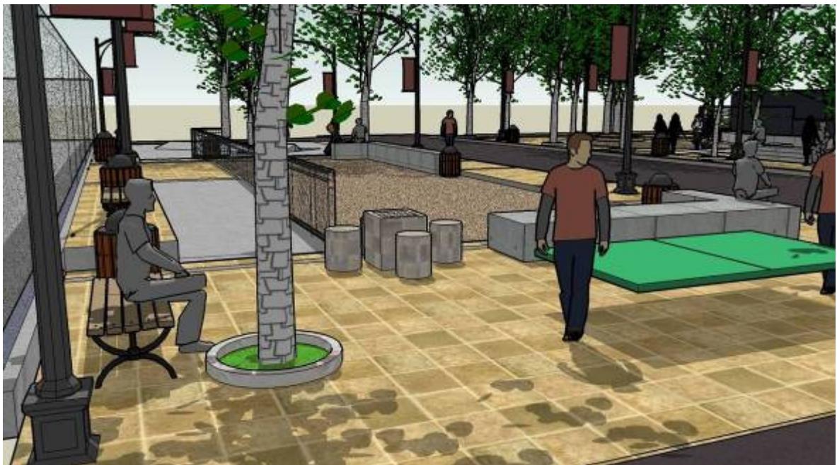
Vista zona lateral Multicancha.