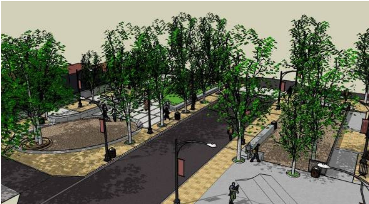
Vista aérea hacia Nor Poniente.