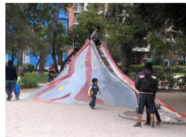
Imágenes referenciales juegos plaza Brasil