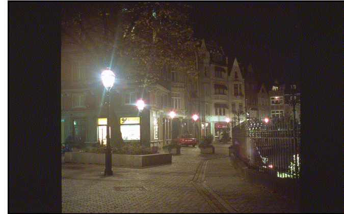
Crear ambientes seguros