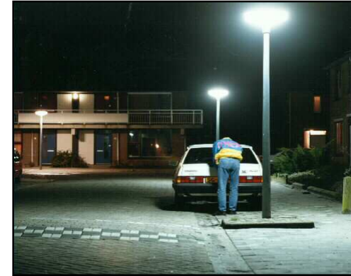
Calidad de Color