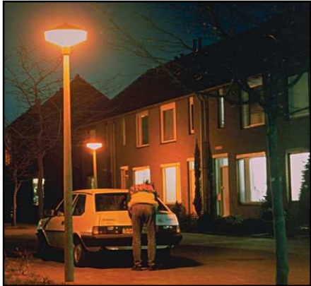
Sentimiento de seguridad