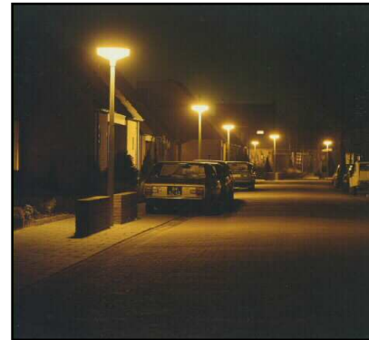
Orientación del Tránsito