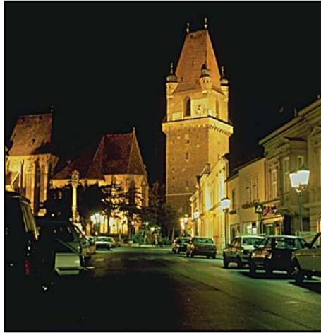
Creación de Identidad