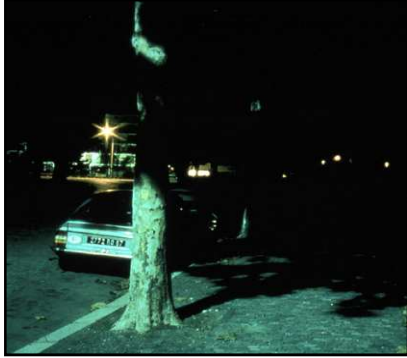
Hacer los objetos Visibles