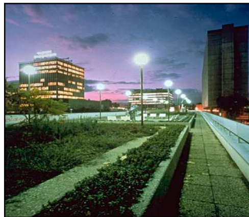
'Resumen' visual del area