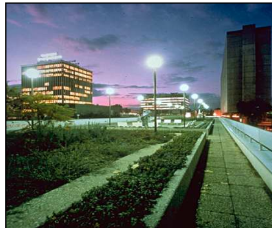
Ambiente: Creación de Atmósfera