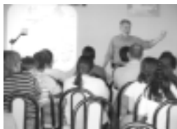
Imágenes de la situación inicial y los procesos de organización social.