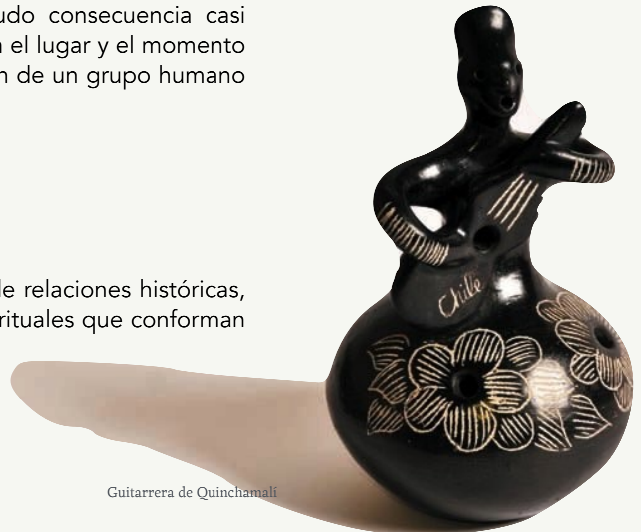
Guitarrera de Quinchamalí