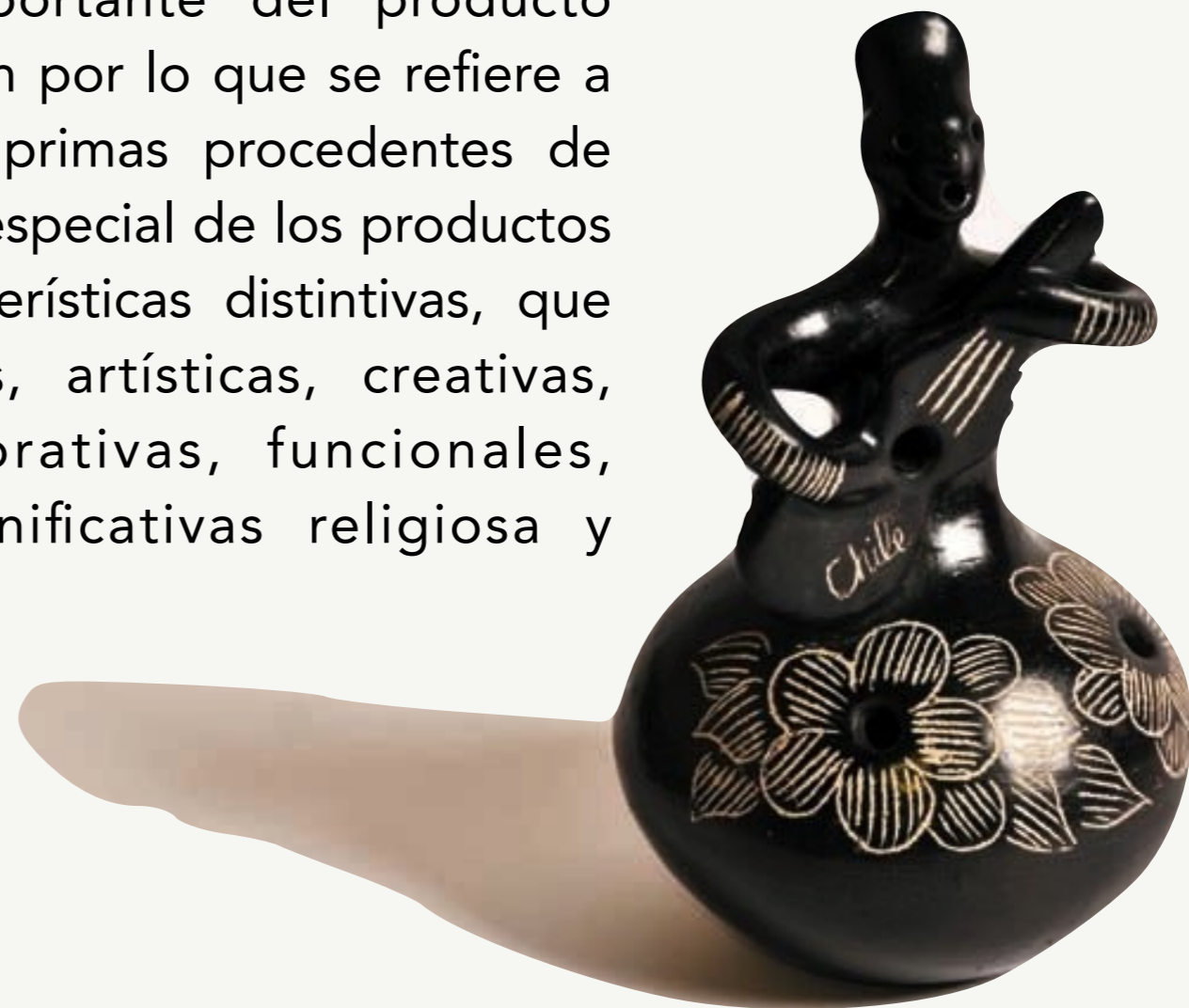
Guitarrera de Quinchamalí