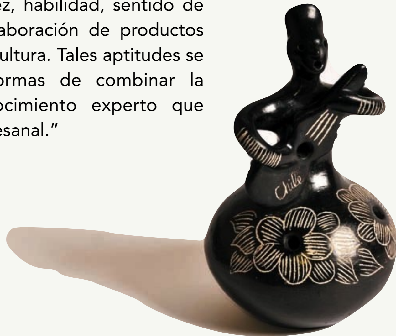
Guitarrera de Quinchamáli