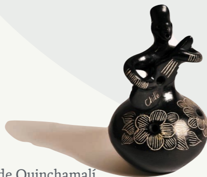
Guitarrera de Quinchamali