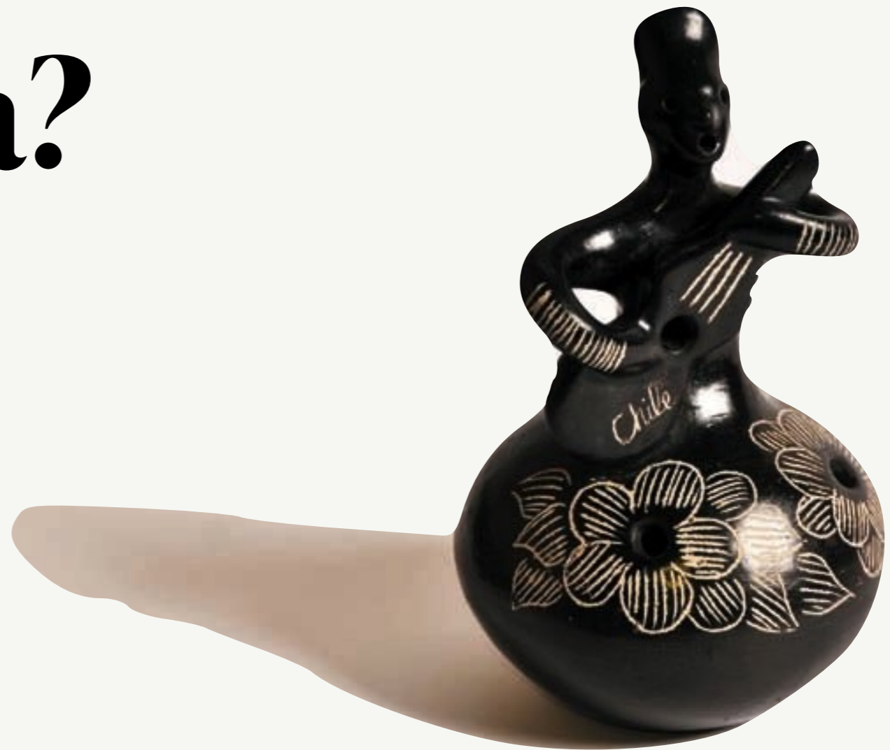
Guitarrera de Quinchamáli