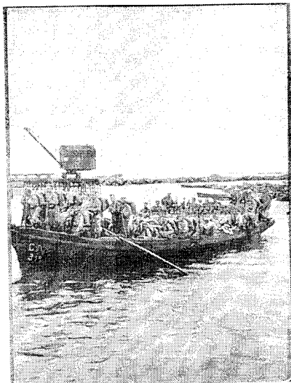
Desembarco de tropas en Iquique, diciembre de 1907