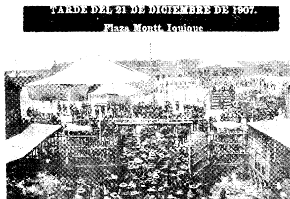
La plaza Manuel Montt en la tarde de la matanza

La radicalización del movimiento obrero basado en una mayor conciencia de clase es la gran consecuencia de la matanza de Santa María, pero, además, coincide con el inicio de una etapa de descenso de la movilización popular. Esta contradicción no proporciona una explicación suficiente al proceso de formación de la conciencia de clase. Ello nos obliga a centrar nuestra atención en el impacto generado a raíz de la matanza de Iquique, buscando respuestas en el comportamiento real y discursivo de los diversos actores sociales y políticos, tanto en el ámbito nacional como especialmente tarapaqueño. Ellos nos aclararán las implicancias de este hecho, tanto a nivel del acontecimiento mismo como de sus consecuencias, especialmente en lo referente a la radicalización posterior del conflicto social y sus repercusiones en la difusión de la conciencia de clase en el proletariado chileno.