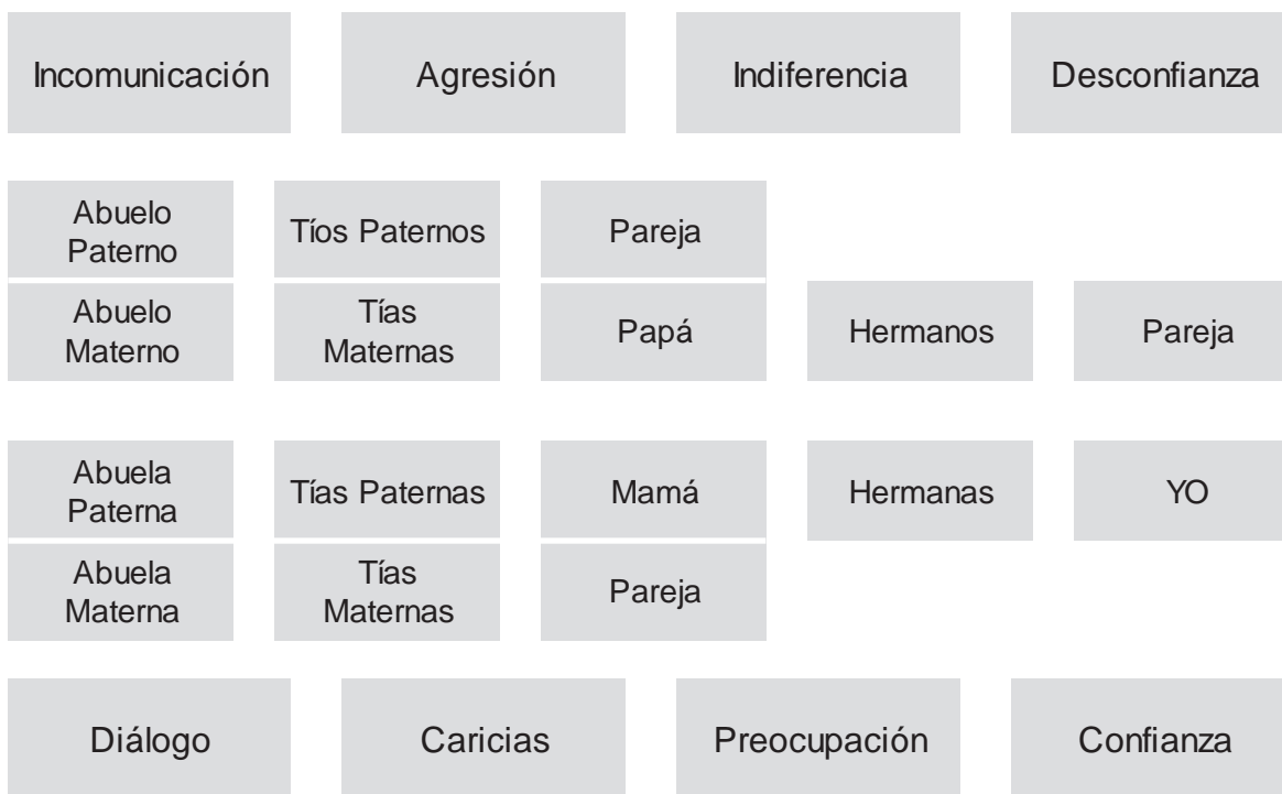
DIAGRAMA AMOR Y AFECTIVIDAD

Elige un símbolo que mejor represente la relación que tienes con tu familia. Cuando lo tengas pensado, dibújalo.