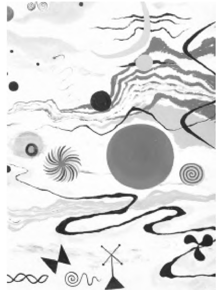
Alexander Calder, Fond clair , óleo sobre lienzo, 1949.