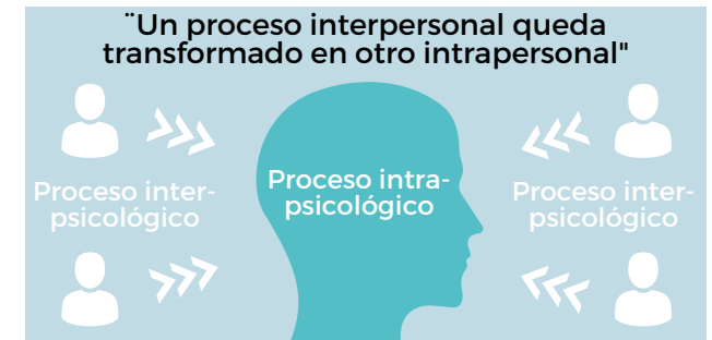
Ley de Doble Formación