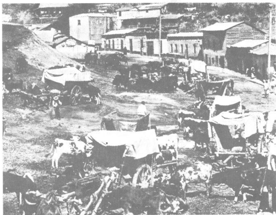
UNA CAÑADA CAMPESINA (ca. 1900) (De: R. Lloyd, Impresiones de la República de Chile , Londres, 1915)