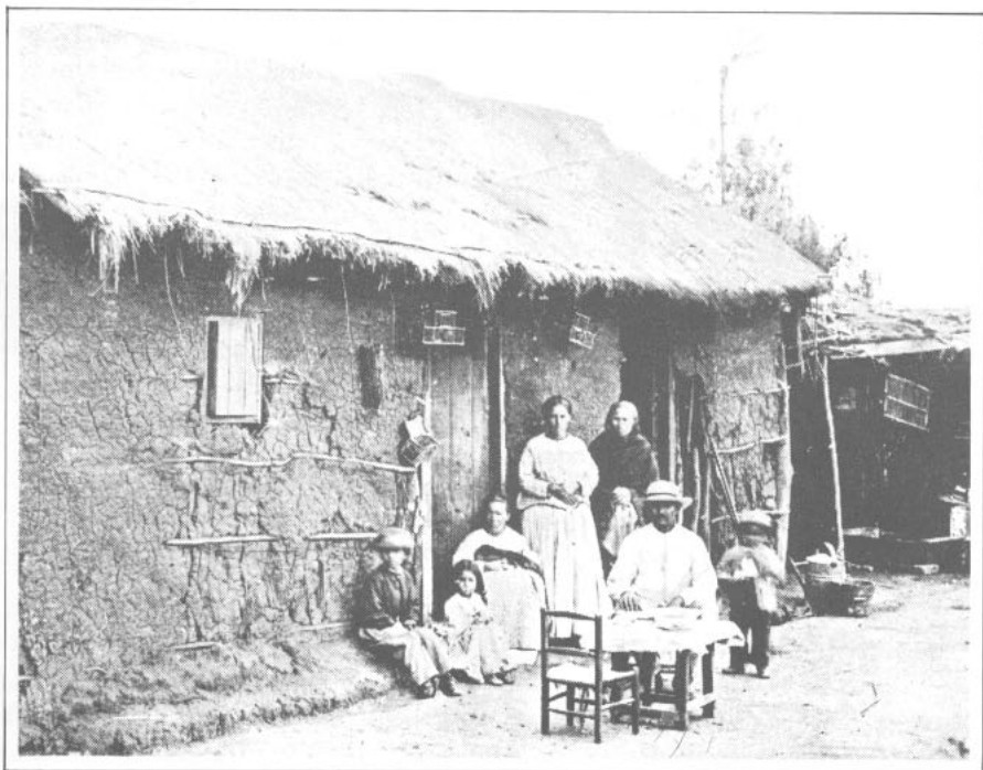
UN RANCHO RURAL (ca. 1900) (De: R. Lloyd, Impresiones de la República de Chile , Londres, 1915)