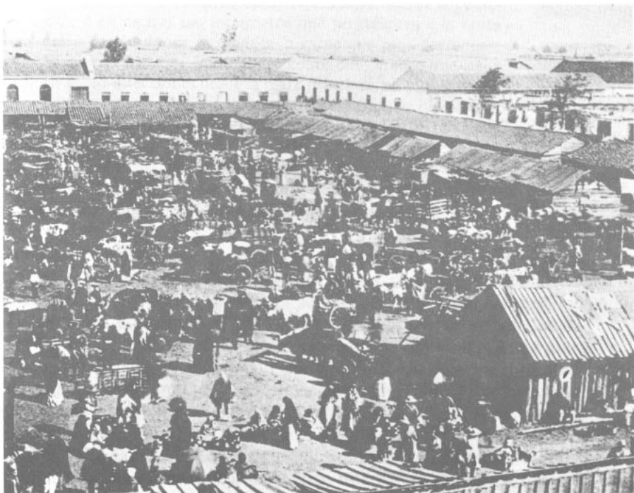
COMERCIO CAMPESINO: FERIA (ca. 1900) (De: T. Wright, The Republic of Chile , Philadelphia, 1905)