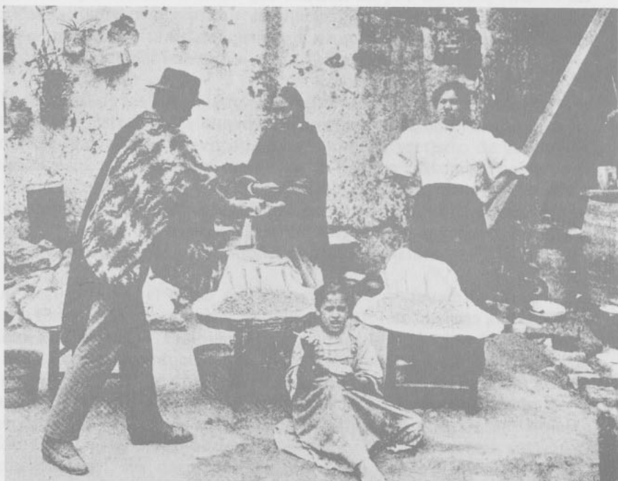
COMERCIO PEONAL: VENDEDORAS DE MOTE (ca. 1900)