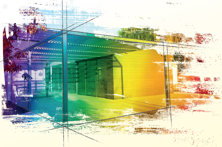
Universidad de Chile Centro de Aprendizaje Campus Sur (CeACS) ISBN: 978-956-19-0937-3

El año 2012 y en el marco del Proyecto “Profundización de la equidad educativa de la Universidad de Chile: foco en la calidad de vida y aprendizaje de los estudiantes, UCH 1199 y UCH 1299”, se instala el Centro de Aprendizaje de Campus Sur (CeACS), primero de su tipo en la Universidad de Chile ya que focaliza al estudiante como actor clave del proceso de enseñanza y aprendizaje.