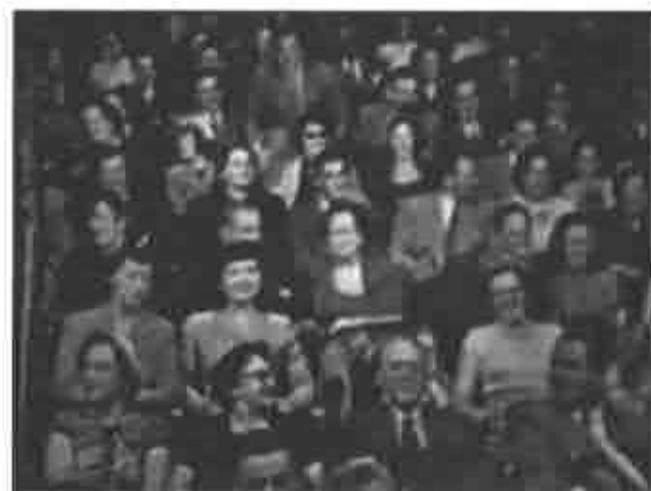
The Texaco Star Theater , 1951.

Para los estadounidenses de posguerra, presenciar un show en vivo en el estudio era un evento cultural estimulante. Gente de todo el país se acercaba para participar como público de estudio en los programas de TV. Cuando la Centre Television Theatre de la NBC se inauguró en 1950, la cadena informó haber recibido cerca de 90.000 solicitudes de entradas para su primera transmisión. 12 En 1954, el periódico The New York Times informó que los programas de televisión filmados en Nueva York tenían una concurrencia anual que excedía ampliamente el millón y medio de personas, y que la transmisión televisiva figuraba entre los principales entretenimientos de la ciudad (Cotler, 1954). 13 Al comentar la importancia global de las audiencias en el estudio durante los primeros programas, un crítico del New York Times concluyó que "Cadenas, auspiciantes y actores, todos consideran a un buen público presente como un fuerte valor agregado para un show" (Cotler, 1954).