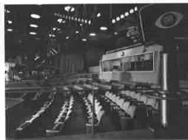
CBS Television City, 1953.