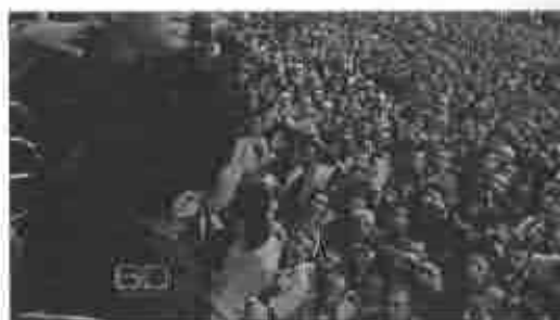
60 Minutes: Los originales en color están en http://www.60minutes.com.ar/13tomamas.php

Ghonim también reconoció que los medios televisivos tradicionales de noticias cumplieron un rol central diseminando el mensaje de la Revolución 2.0 en la arena mundial. En un tweet al periodista de CNN Wolf Blitzer, Wael Ghonim escribió: "No vamos a olvidarlos. Los medios internacionales salvaron vidas. Ustedes también son héroes".