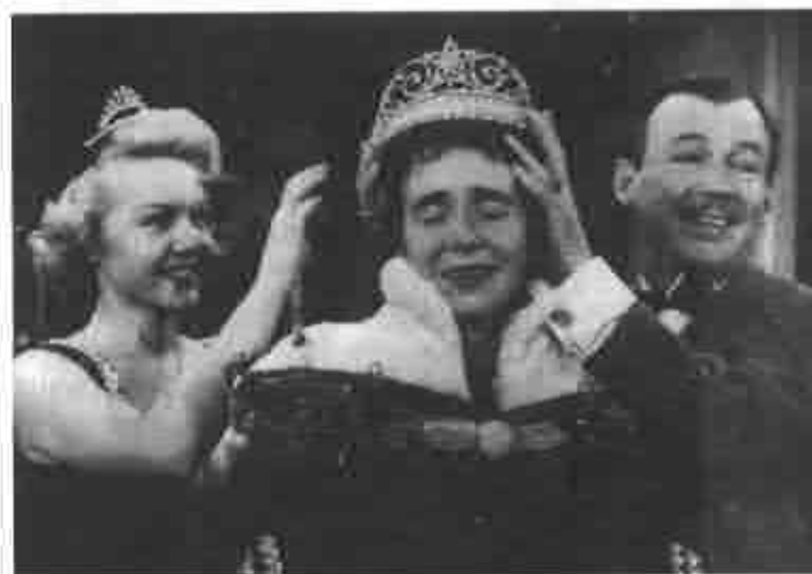
Queen For a Day , ca. 1958.

estadounidense a través del género "courtroom drama". They stand accused (CBS y cadena DuMont, 1949-1954) era una simulación no guionada de un juicio con magistrados y abogados reales, y una audiencia en vivo que oficiaba como el "jurado" del caso y decidía su veredicto. En éste y otros programas se borronaban las líneas entre la audiencia y el público ciudadano, al grado que formar parte de la audiencia de la televisión comercial se reconfiguró como un acto democrático. Estas votaciones y reconstrucciones de juicios le mostraban a la gente que ser audiencia televisiva de masas no era simplemente una forma de matar el día, sino una manera de contemplar los procesos democráticos en acción. En este sentido, estos programas canalizaban lo que la historiadora Elizabeth Cohen (2003) llama la ideología de posguerra de "ciudadanía de consumo", en la cual se pregona que ser un buen ciudadano consistía en mantener girando las ruedas del comercio para el bien de la nación.