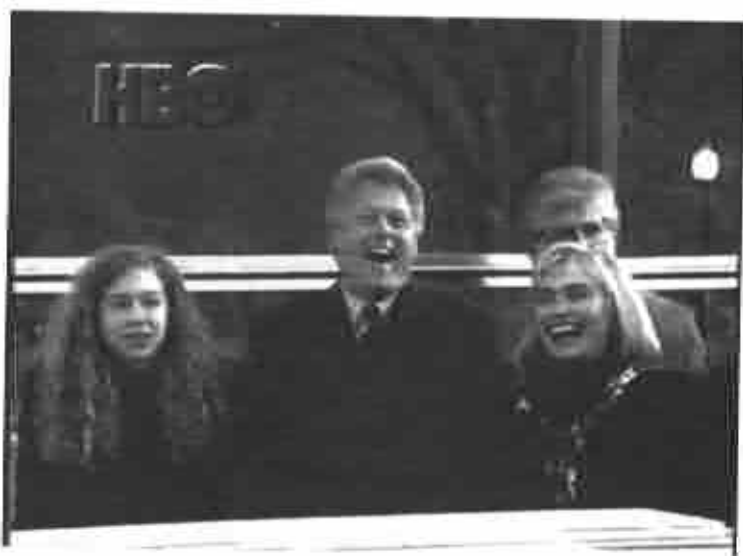
Acto de asunción del Presidente Clinton por HBO, 1992. El original en color está en http://www.rehime.com.ar/libromasas.php .

pueblo al mostrarse como parte de una audiencia que ve desarrollarse el espectáculo de su asunción. Una lista de celebridades racialmente diversa incluyendo a Oprah Winfrey, Tony Bennett, Aretha Franklin, Whoopi Goldberg, Rubén Blades, Kenny Rogers, James Olmos, Stevie Wonder y muchos otros actuaron en el exterior del Lincoln Memorial en Washington. La retórica de las tomas del programa iba y venía entre las actuaciones estelares e imágenes de Bill, Hillary y Chelsea Clinton, al igual que el vicepresidente Al Gore y su familia, todos sentados entre una gran multitud. La cámara se posa en las caras embelesadas de los Clinton sonriendo ampliamente y aplaudiendo. El programa incluyó presentaciones espectaculares como la de Diana Ross vestida de rojo, blanco y azul cantando "God Bless America", mientras que el gran final fue con el invitado sorpresa Michael Jackson lanzando una versión de "We are the world" con todas las demás luminarias. En medio de la canción, Diana Ross llama a los Clinton y los Gore al escenario, donde las familias presidenciales cantan el tema con los artistas mientras la cámara se aleja en una toma aérea mostrando el amplio mar de gente que presenciaba el evento.