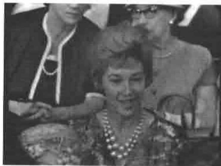
It Could Be You , ca. 1958.

Aunque resulta difícil evaluar sus verdaderas filiaciones de clase, los integrantes de la audiencia en estudio generalmente se comportaban de una forma que sugería que entendían que participar en un show de TV era un evento decididamente orientado a la familia de clase media. En otras palabras, habían asimilado la noción de los productores de comportarse como "invitados a la casa". Los paneos de la audiencia a menudo mostraban principalmente a blancos haciendo sus mejores atuendos: trajes, corbatas y habitualmente sombrero en los varones; trajecitos o vestidos a medida, guantes blancos, tocados e incluso arreglos florales en las mujeres. Una panelista describió su participación en un popular programa diario de televisión contando que ella y su madre se arreglaron "de punta en blanco, con sombreros, guantes y trajecitos porque sabían que iban a aparecer en televisión" (cit. por Ganas, 1996).