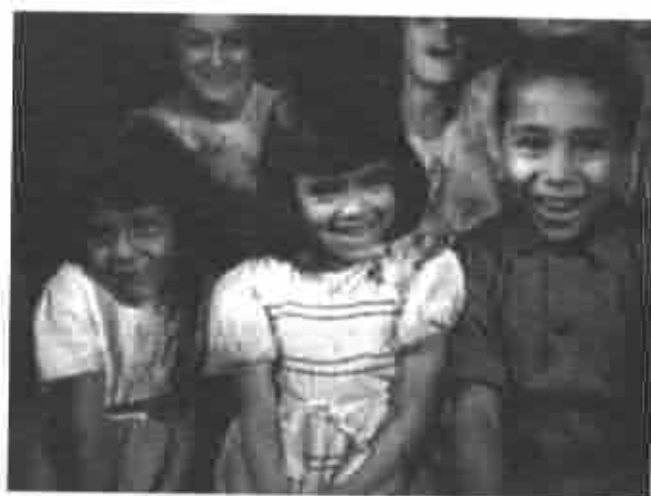
Behind Your Radio Dial, 1947.

del país e inmediatamente comenzó a expandirla en una cadena. Agregando imágenes al sonido, abrió una ventana electrónica levantando la cortina mágica e invitándolo al mejor asiento de la primera fila: su propio sillón.