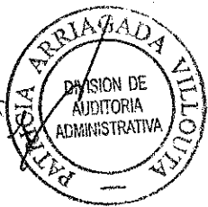
JEFE (S) AREA HACIENDA, ECONOMIA Y FOMENTO PRODUCTIVO DIVISION DE AUDITORIA ADMINISTRATIVA