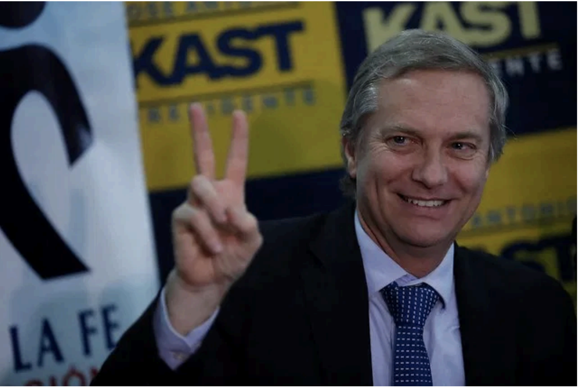
José Antonio Kast: Es o no es populista?