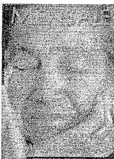
Sumario Revista Mensaje