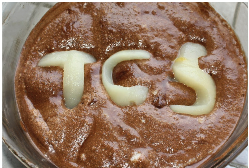
Mousse de chocolate casero.

De manera similar, los algoritmos diseñados para producir una salida particular (e.g. ordenar un arreglo) implícitamente describen un objeto a través de su proceso (e.g. codificar una permutación), y es poco el trabajo adicional requerido para almacenar ese objeto (e.g. anotando el resultado de cada comparación realizada por el algoritmo de ordenamiento). En algunos casos particulares (e.g. merge sort ), esta codificación ha resultado ser útil (e.g. estructuras de datos comprimidas para permutaciones, más pequeñas y más rápidas que las previamente conocidas). BITS