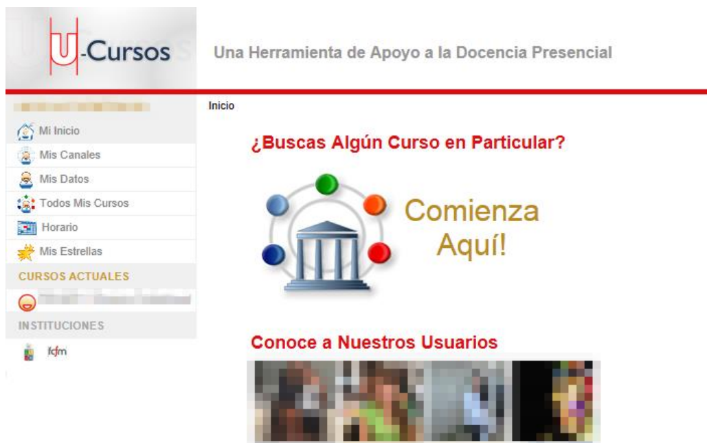
FIGURA 4: PANTALLA DE ACCESO A U-CURSOS

PASO 4: Si los datos que ingresaste son correctos, verás la pantalla de inicio de U-Cursos ( figura 4 ) con los cursos correspondientes a tu programa (curso de especialización/diplomado) a la izquierda de la pantalla. Al hacer clic en cualquiera de ellos, podrás acceder a los distintos módulos del curso.