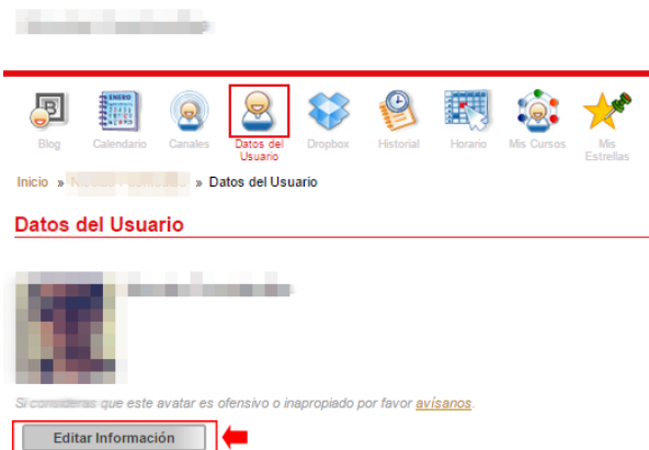
FIGURA 6: BOTÓN 'EDITAR INFORMACIÓN'

PASO 6: En la página que se mostrará, haz clic en el botón 'Editar Información' ( figura 6 ).