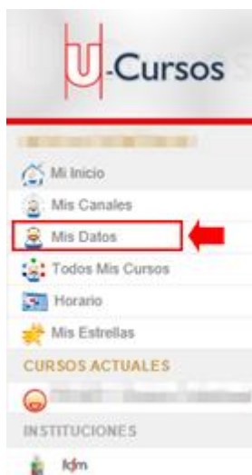
FIGURA 5: OPCIÓN 'MIS DATOS'

PASO 5: ¡Asegúrate de que tu correo está actualizado! Entra a la sección 'Mis datos' como muestra la figura 5 .