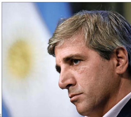
Luis Caputo deja el ministerio de Finanzas y asume la presidencia del Banco Central, en reemplazo de Federico Sturzenegger.

Federico Sturzenegger, presidente del BC argentino, presentó su renuncia a Mauricio Macri por medio de una carta que él mismo divulgó a través de su cuenta de Twitter. "En los últimos meses diversos factores fueron deteriorando mi credibilidad como presidente del Banco Central, atributo clave para llevar adelante la coordinación de expectativas (...) motivo que hoy me impulsa a presentarle mi renuncia", señaló Sturzenegger.