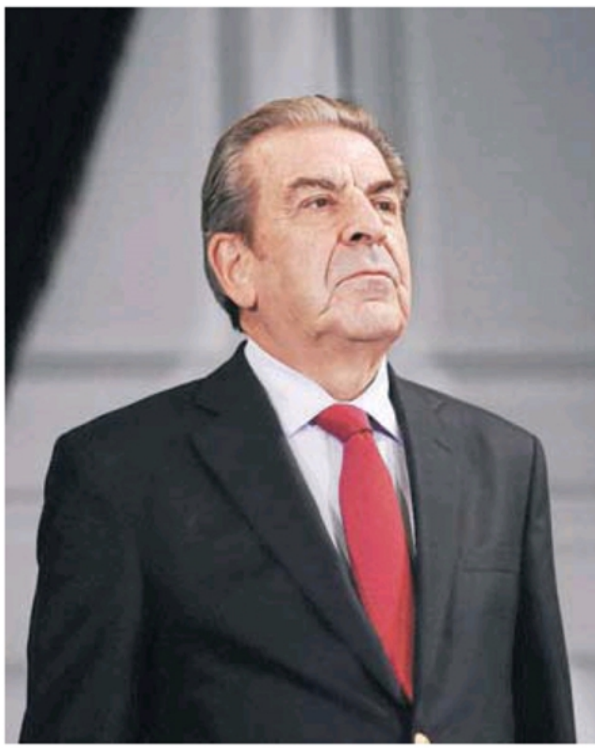
El ex mandatario es embajador en misión especial para el Asia Pacífico.

La Comisión Nacional de Productividad (CNP) se creó por Decreto No. 270, del 9 de febrero de 2015, del Ministerio de Economía y Hacienda.