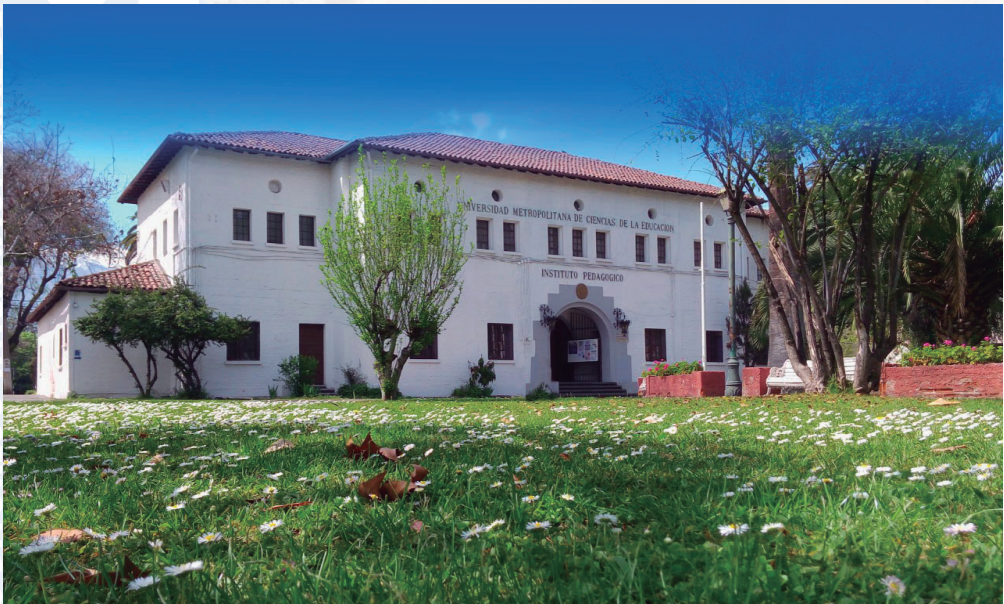
Frontis de la entrada principal de la UMCE

En la UMCE se encuentran en su interior el Pabellón Griego sede del Centro de Estudios Griegos, Bizantinos y Neohelénicos “Fotios Malleros”.