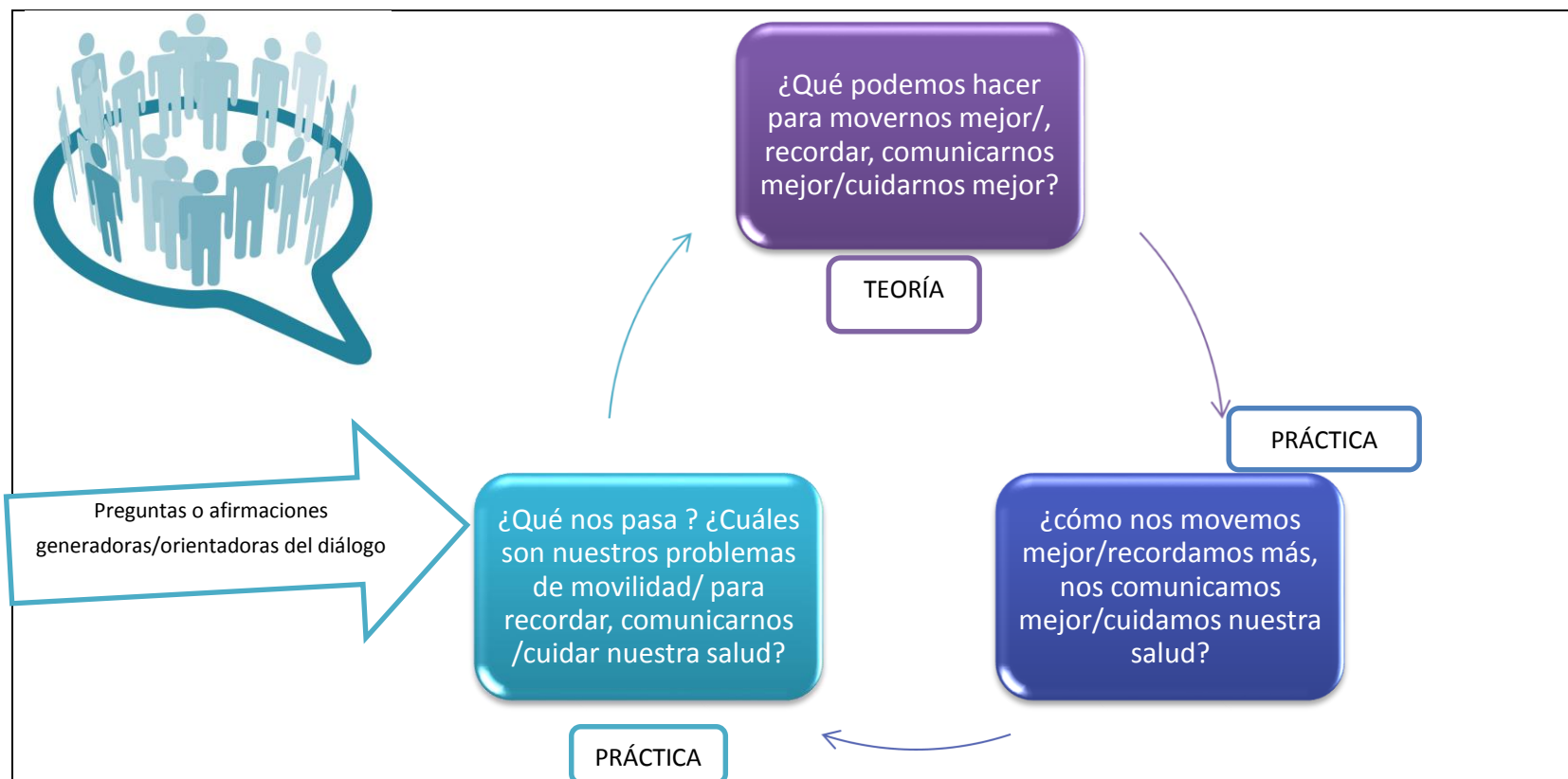
Diagrama 3. Ejemplo de Ciclo sugerido en proceso educativo para trabajo en talleres del Programa de Estimulación Funcional.

Las técnicas a utilizar deben estar en función del proceso de formación, entendiendo que este tiene un sentido direccional de acuerdo a los objetivos del Programa y las necesidades o requerimientos expresados por los Adultos Mayores Participantes y que se implementa de acuerdo a las personas con que se ejecutan y el tiempo disponible.