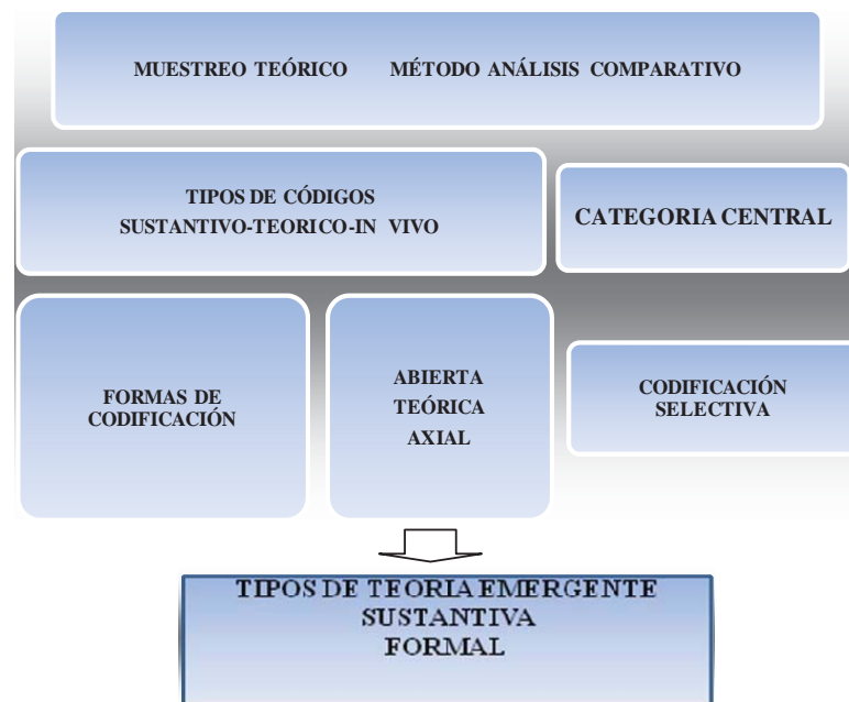
Figura. 1 Componentes de la teoría fundamentada en los datos

los datos según los trabajos desarrollados por Glaser y Strauss (1967), Glaser (1978, 2000), Strauss y Corbin (2002).