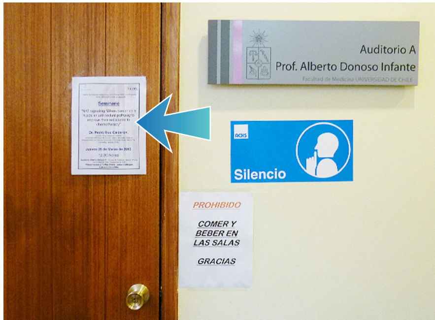
AUDITORIO PROF. ALBERTO DONOSO INFANTE