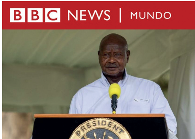
BBC - El presidente de Uganda firma la polémica ley que castiga la homosexualidad.

Los actos homosexuales ya eran ilegales en el país africano, pero ahora cualquier condenado puede enfrentarse a cadena perpetua.